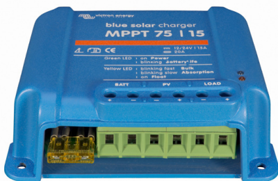
Solar-Laderegler MPPT 75/15